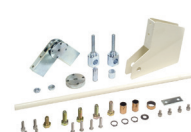
Zestaw łamania do ramienia szlabanu - maks. wysokość pomieszczenia 3 m (tylko do standard. ramion prostokątnych)