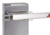
Uchwyt mocowania ramienia owalnego wychylnego - (INOX)

Nie ma możliwości instalacji fartucha, podpórki pod ramię lub podpory stałej na nowych ramionach wychylnych.