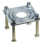
Podstawa fundamentowa do podpory stałej