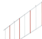
Fartuch 2 m pod ramię szlabanu