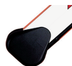
Mocowania do ramion prostokątnych lub owalnych ♦

Ramiona prostokątne posiadają gumowe zabezpieczenia przeciwuderzeniowe. Ze względu na właściwe wyważenie ramienia, aktywne zabezpieczenia nie mogą być instalowane na ramieniu.