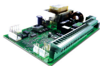
Wbudowana centrala sterująca 624 BLD