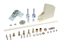
Zestaw łamania do ramienia szlabanu - maks. wysokość pomieszczenia 3 m (tylko do standard. ramion prostokątnych)