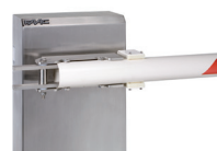
Uchwyt mocowania ramienia owalnego wychylnego - (INOX)

Nie ma możliwości zamontowania "firanki", podpory ruchomej czy też podpory stałej w przypadku okrągłych ramion wychylnych.